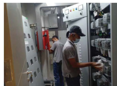
ภาพที่ 3-3 ตรวจสอบ ตรวจสอบเช็คระบบไฟฟ้า