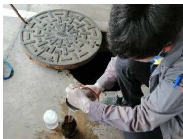
น้ำทิ้งออกจากระบบบำบัด