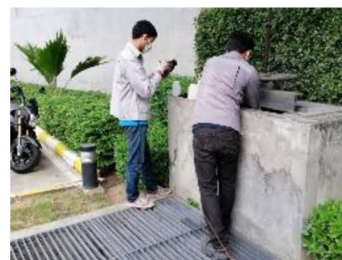
บ่อพักสุดท้ายก่อนปล่อย