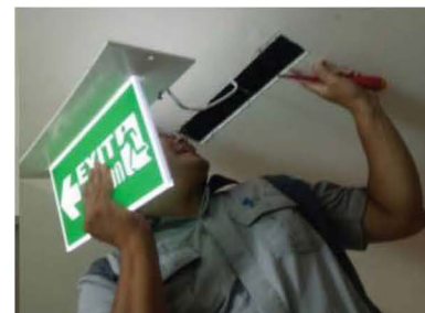
ภาพที่ 3-2 ตรวจสอบ ตรวจสอบเช็คระบบป้องกัน แจ้งเตือน ระวังเหตุอัคคีภัย